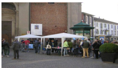
Persone in attesa di salire sul Campanile